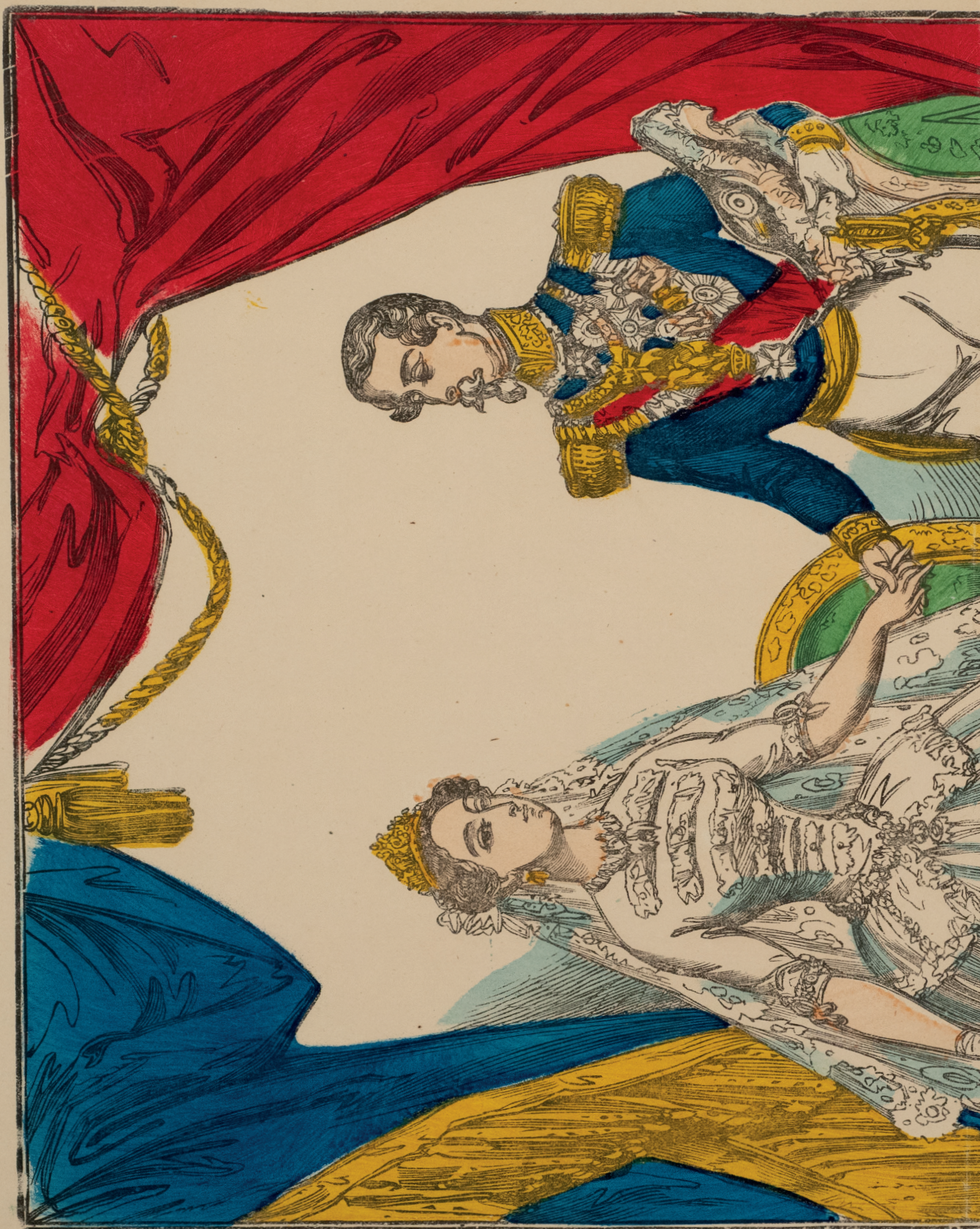
Napoléon III, empereur des Français Jean-Baptiste Vanson (graveur) Gravure sur bois coloriée au pochoir - Coll. M.