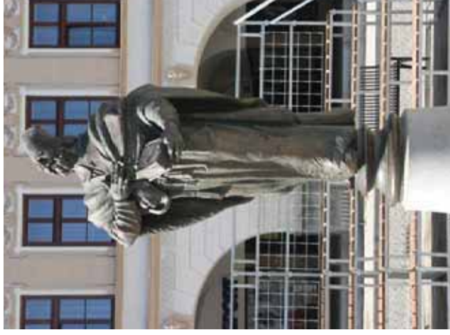
Saint-Nicolas - Place Masarik

En 2008, après l'inondation qui détruisit habitations, ponts et voies ferrées, d'importants travaux de restauration furent entrepris et ce fut l'occasion pour cette place de faire peau neuve, tout en gardant son cachet historique, comme la fontaine en pierre au-dessus de laquelle dansent deux