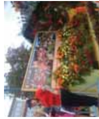
Char de Schwäbisch Hall

Le corso fleuri s'est une nouvelle fois étoffé de chars représentant trois de nos villes jumelles : Chieri, Schwäbisch Hall et Gembloux. Même si le soleil n'était pas au rendez-vous le dimanche, les coeurs en étaient remplis et les sourires radieux.