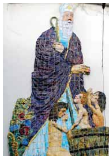
mosaïque de 1967 par M. Hutin rue François Blaudez

Le culte du Saint a popularisé sa légende. Elle est très riche. Chaque épisode de sa vie a été décrit par Jacques de Voragine , un dominicain qui devint