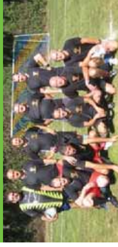
Equipe du SDIS 88

En juin dernier, à l'occasion des journées portes ouvertes de la caserne de pompiers de Schwäbisch Hall, 2 véhicules neufs étaient inaugurés en présence de la ministre de la Sécurité Civile. Ensuite les pompiers-sportifs de nos casernes respectives ont disputé un tournoi amical de football ; les spinaliens se sont classés troisième sur douze équipes.