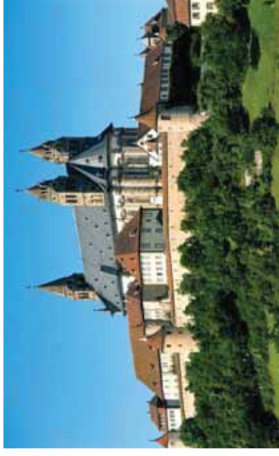
Eglise Saint-Nicolas à Schwäbisch Hall fait partie de l'ensemble de l'abbaye bénédictine de la Comburg