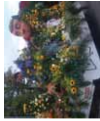
Char de Gembloux