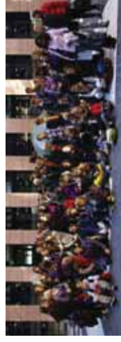
Groupe franco-allemand en visite au Parlement Européen de Strasbourg

La seconde partie de l'échange à Schwäbisch Hall se déroulera du 29 décembre au 9 janvier.