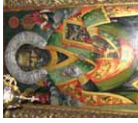
Saint-Nicolas - Bibula, dans une église orthodoxe de Bitola