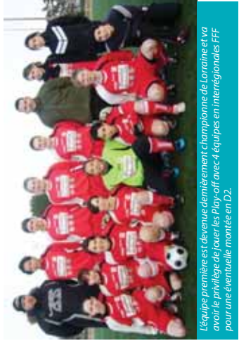
L'équipe première est devenue dernièrement championne de Lorraine et va avoir le privilège de jouer les Play-off avec 4 équipes en interrégionales FFF pour une éventuelle montée en D2.

Mais cela ne s'arrête pas là ! Nos amis allemands ont organisé une belle surprise pour nos sportives spinaliennes en leur offrant leurs billets pour assister ensemble au match France-Nigeria Sinshheim, le 26.