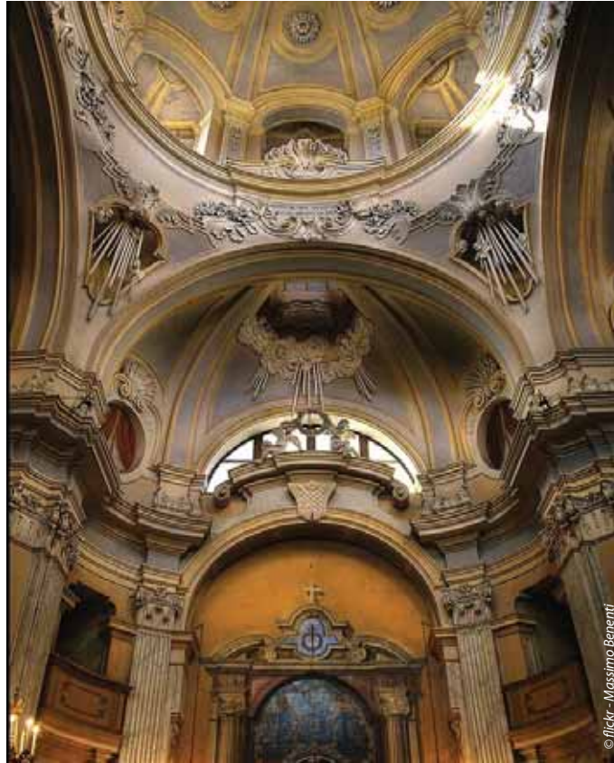
Chieri, la ville aux cent clochers... 10 ans d'amitiés partagées